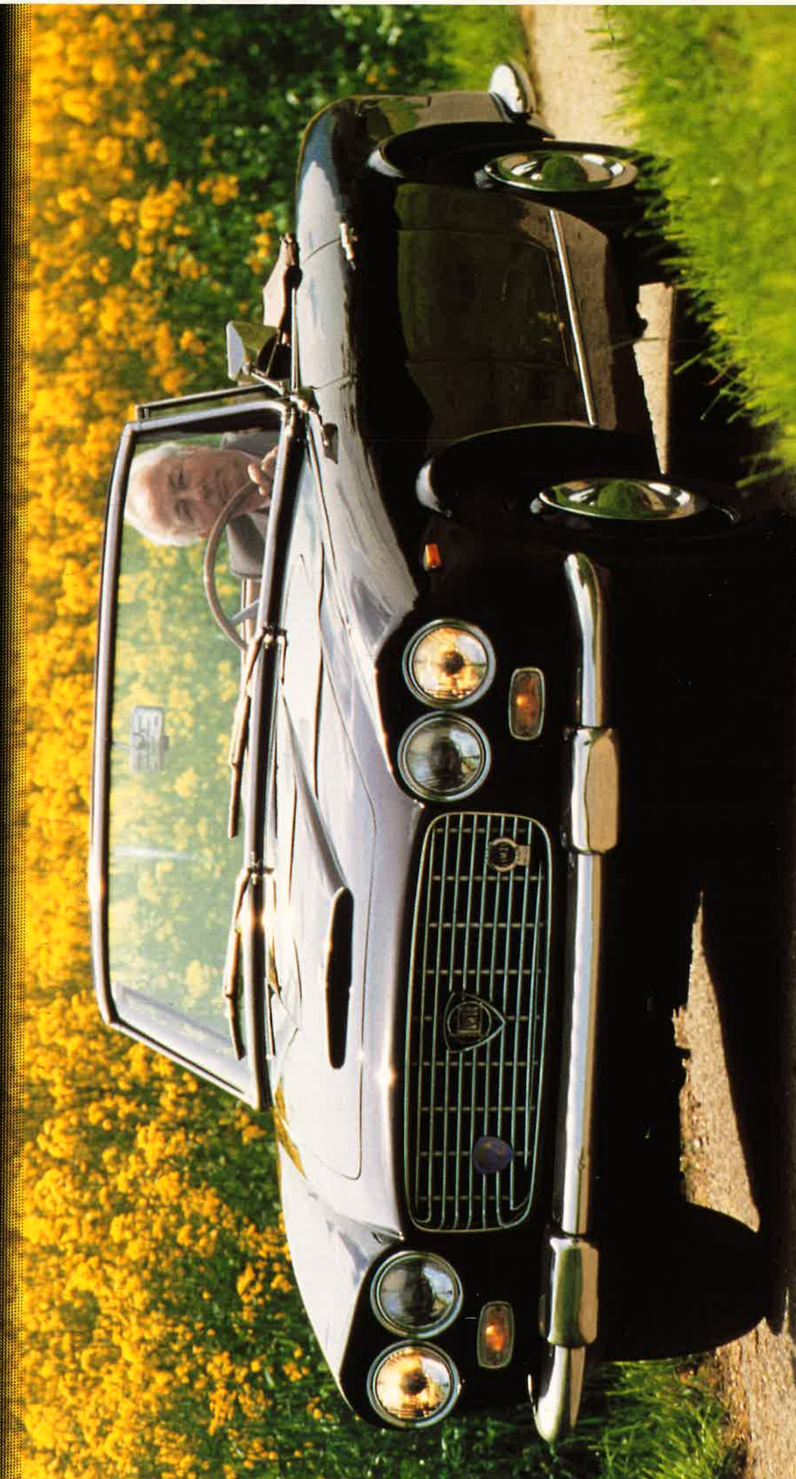
LANCIA FLAMINIA GT 3C